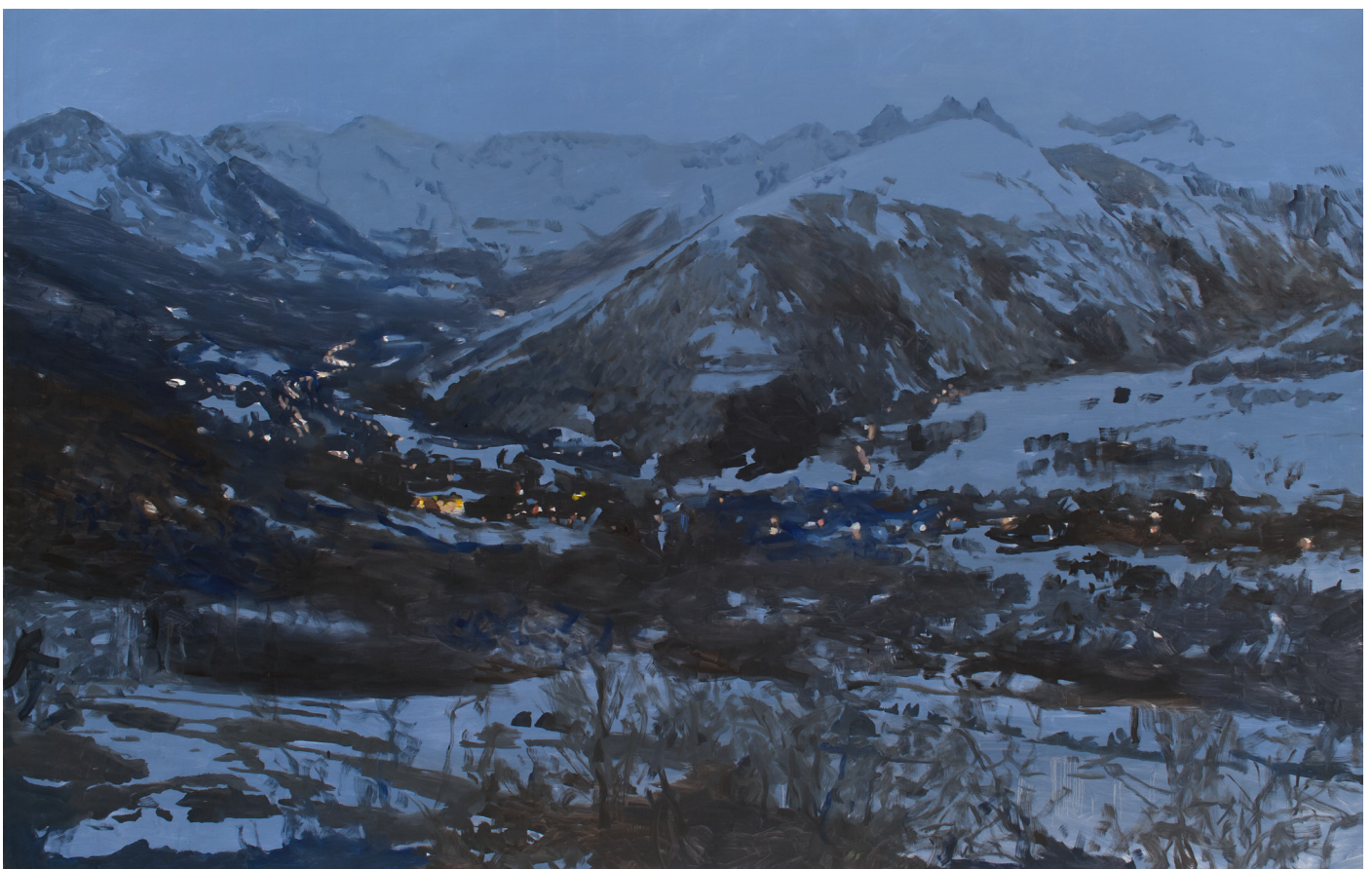
Arthur Aillaud, Sans titre , 2016, huile sur toile, 190 x 300 cm

L'ensemble baigne dans une lumière indéfinissable qui donne une tonalité singulière à ses peintures : aube ou crépuscule ? Arthur Aillaud alimente cette ambiguïté, entre jour et nuit, entre plan et perspective, entre séductions figuratives et rigueur de l'aplat, en laissant ouvertes les différentes interprétations, sans qu'on puisse réduire ni les toiles, ni l'artiste à une perspective unique.