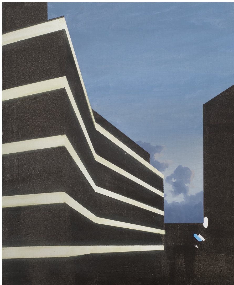
Arthur Aillaud, Sans titre , 2016, huile sur toile, 73 x 60 cm

Vernissage jeudi 22 septembre de 18h à 21h