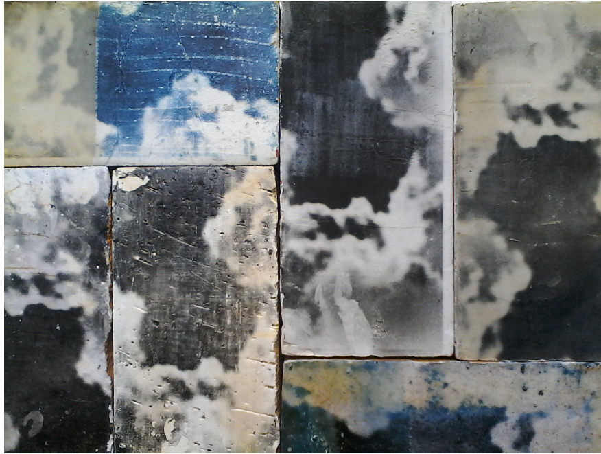
Pauline Sarrus, A Fresco , photographic prints on photosensitized bricks, 2016. Details.

Parallèlement, dans Le Jugement dernier , les fragments retrouvés du fameux tympan de l'Abbaye de Cluny sont réassemblés en un mur d'escalade. Le mur-image devient littéralement un moyen d'élévation.