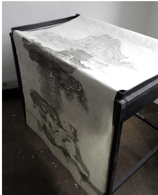
Cadine Navarro, Five Words Meet , sumi in on Sumiya paper, 250 x 100 cm, 2016. Detail. Bassin table.