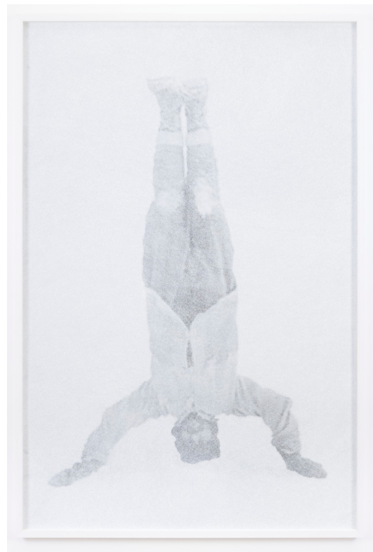
Giulia Manset, Smith , drawing on photograph, 103 x 153 cm, 2016

Deze eerste tentoonstelling van het ontdekkingsprogramma La Forest Divonne-Project Room zet de onderzoeken van drie jonge plastische kunstenaars naast elkaar: een ervan gaat over territorium, een ander over taal, het derde over constructie. Langs verschillende wegen buigen Un Monde flottant , Language Maps en A Fresco zich over de mens. Op die manier leveren ze een bijdrage aan de hedendaagse antropologie.