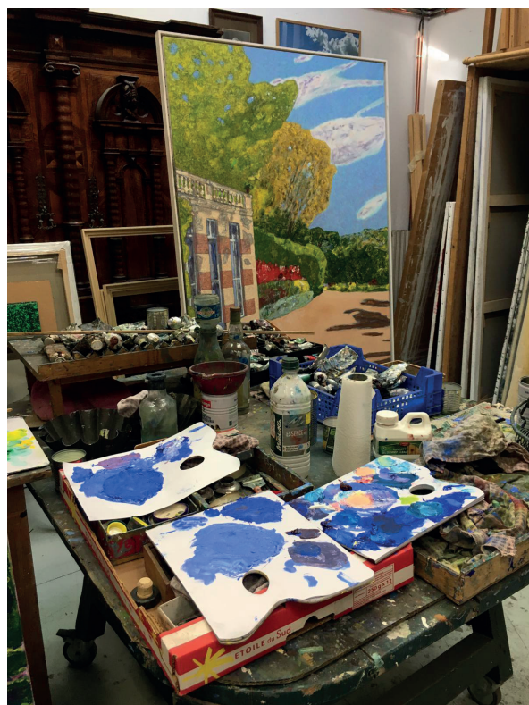
view of the workshop, July 2020