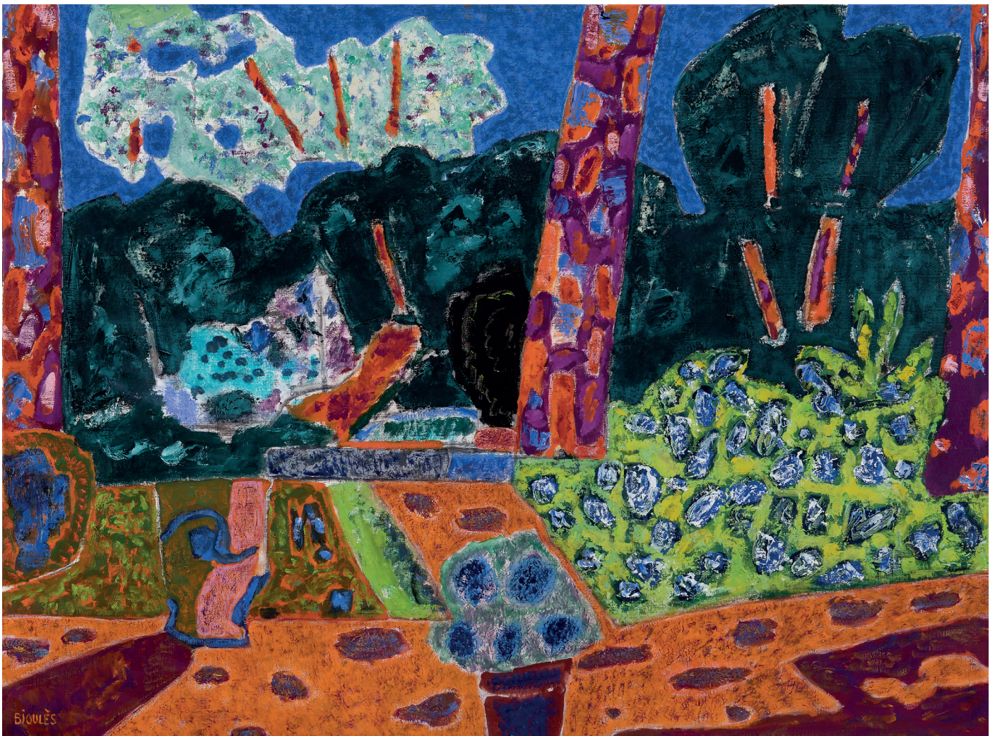
Vincent Bioulès, Sans titre, oil on canvas, 97x130cm, 2020

« Les Douze mois de l'année » (The twelve months of the year), declined the changing lights of the seasons on a landscape near Montpellier: the Etang de l'Or. A place the painter regularly explored over the course of his life. A landscape he sees as a synthetic expression of landscape: a body of water separated from the sky by a thin strip of land, which becomes a line of horizon, simply animated by a small house that can be seen in the distance.