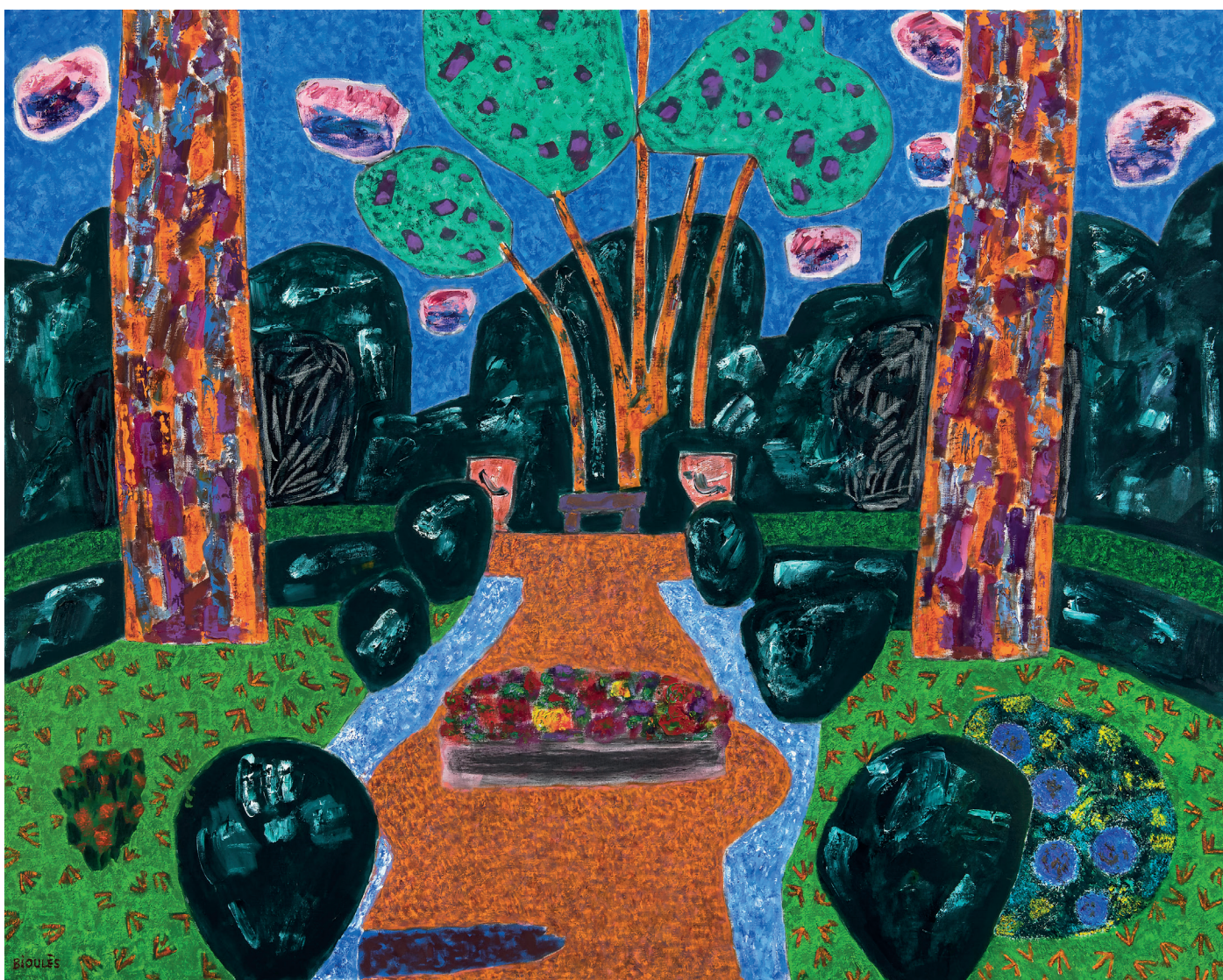
Vincent Bioulès, Jardin, oil on canvas, 130x162cm, 2021