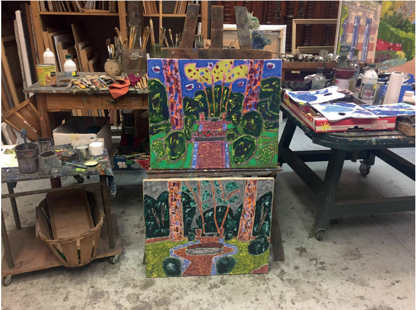
view of the workshop, July 2020

All the diversity of essences, foliages and flowers present in nature, is evoked in a joyful celebration of gardens in fine weather. While Bioulès explores his childhood memories in his father's garden, he leaves aside realism to fully share the sensuality and enjoyment of plants. Everyone will be able to feel the sensation of nature, the strength of its perfumes, by browsing these paintings which capture this dreamed garden at different times of day and night, and in which we would gladly dive.