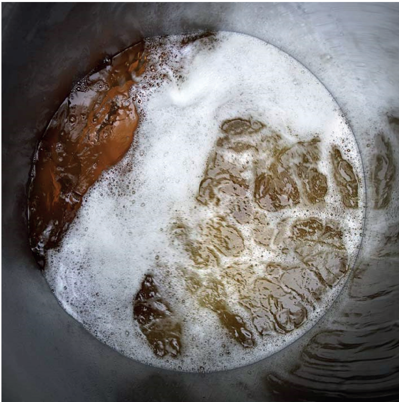
Jean-Bernard Métais, Le Cuvier de Jasnières , 1/6 + 1EA, tirage monté sur aluminium, 95x95cm, 1998

GALERIE LA FOREST DIVONNE PARIS + BRUSSELS