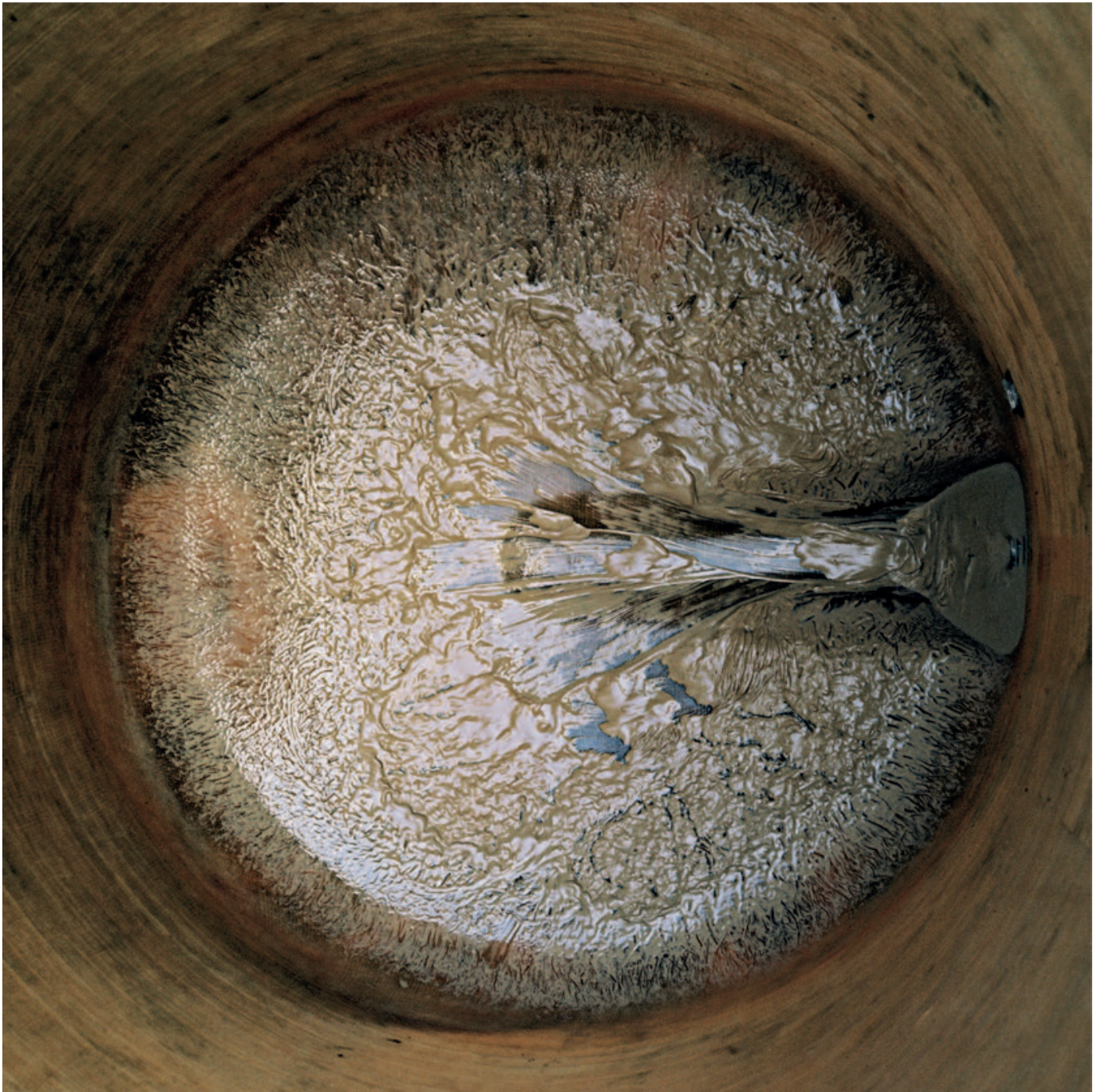
Jean-Bernard Métais, Le Cuvier de Jasnières , tirage monté sur aluminium, 95x95cm, 1998