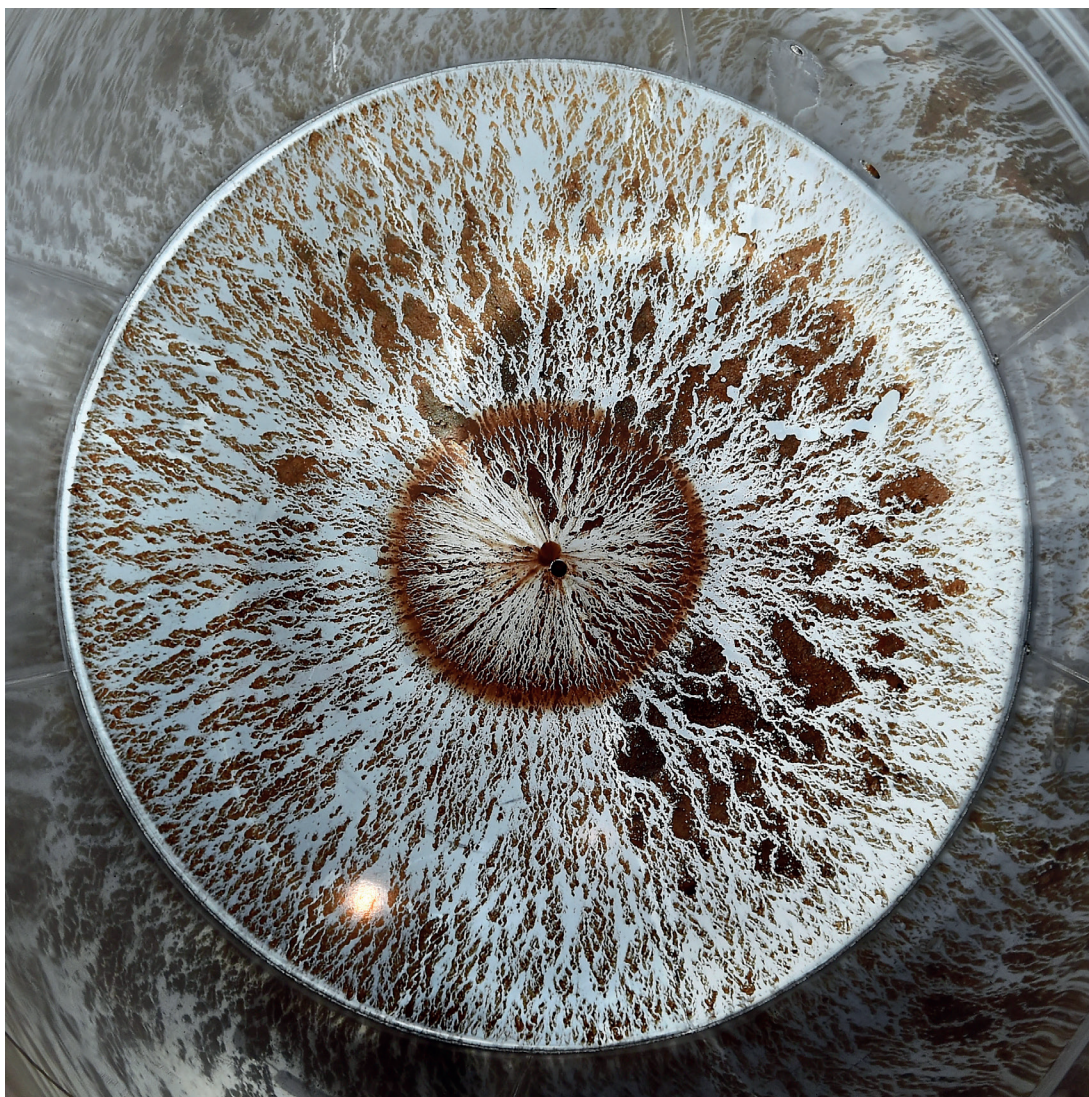
Jean-Bernard Métais, Le Cuvier de Jasnières , photographie, 100x100cm, Isur6, 2016

Virginie Luel - v.luel@galerielaforestdivonne.com - + 32 (0) 478 49 95 97 brussels@galerielaforestdivonne.com - + 32 (0) 25 44 16 73