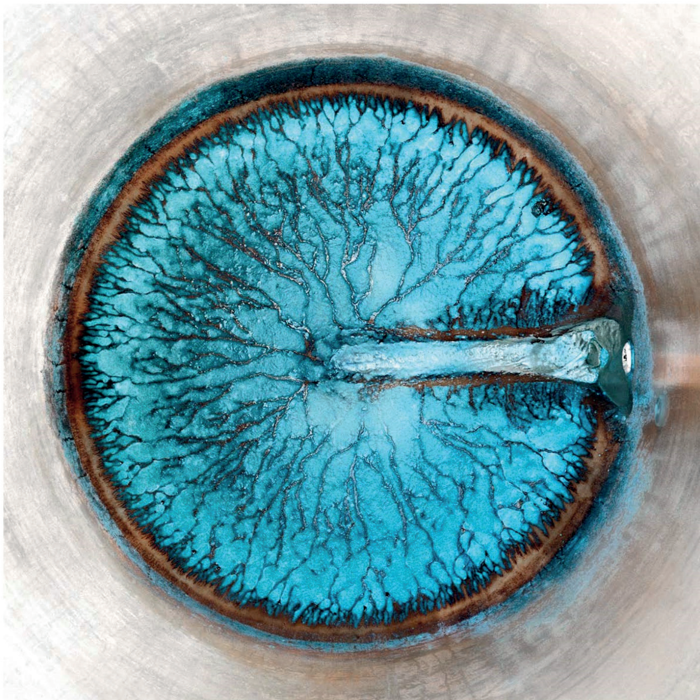
Jean-Bernard Métais, Le Cuvier de Jasnières , tirage monté sur aluminium, 100x100cm, 1976

GALERIE LA FOREST DIVONNE PARIS+BRUSSELS