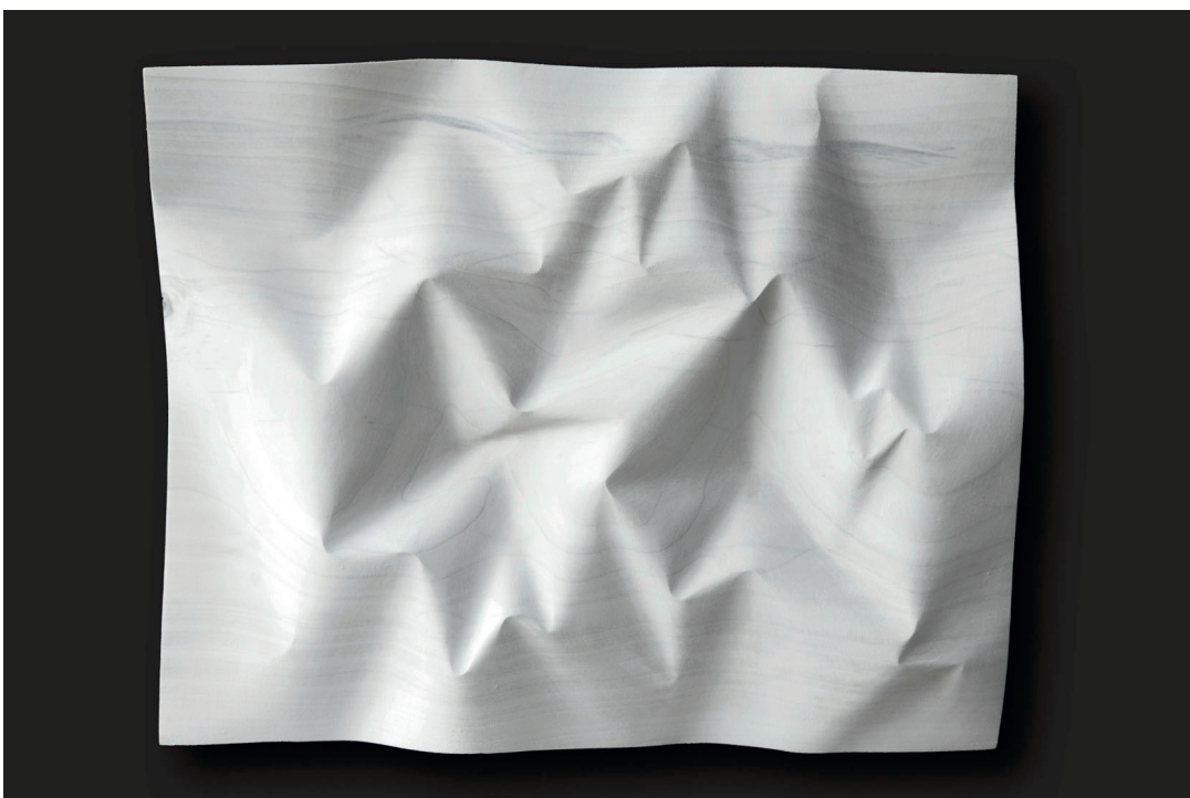
Christian Renonciat, Froissé Haiku , Bois de tilleul, 35 x 45 x 6 cm, 2022