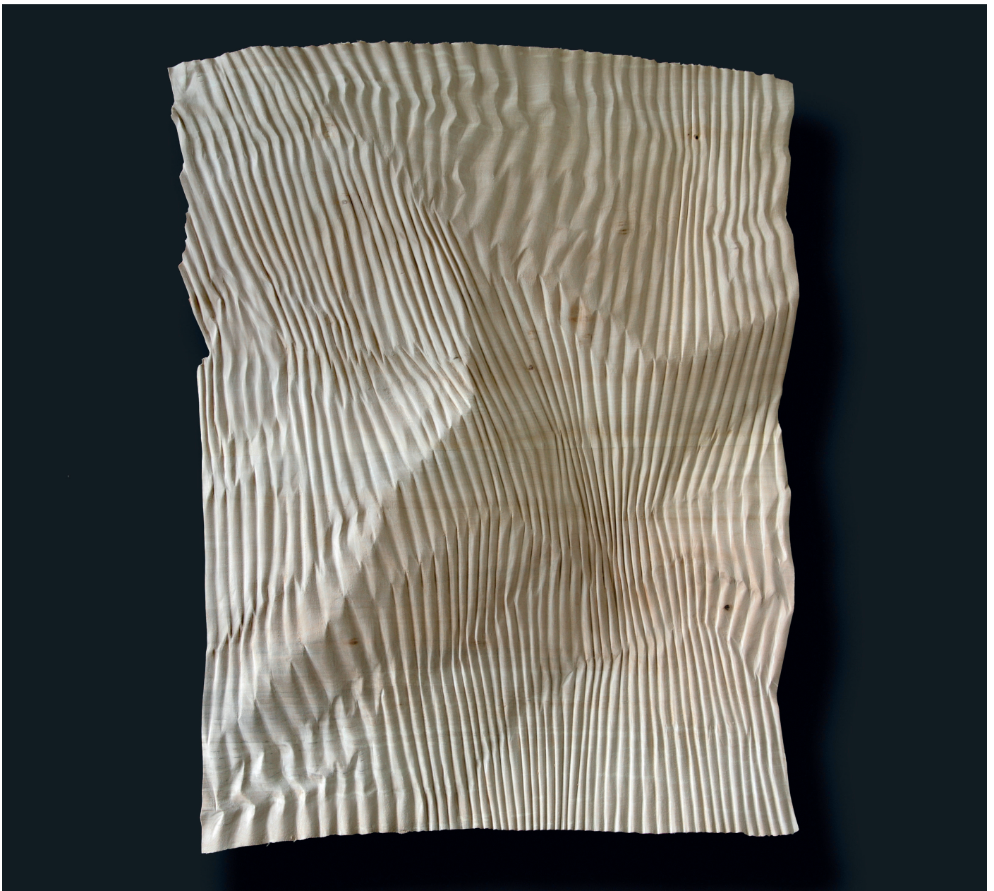
Christian Renonciat, Ondée 1 , bois de tilleul, 75 x 60 x 6 cm, 2022

OPENING Donderdag 12 januari 2023 van 17u tot 21u